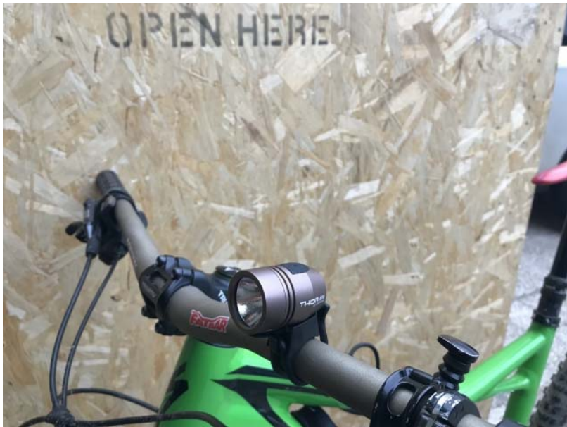
Spanninga Thor 800 je izredno lahka in močna kolesarska luč.

Z vstopom v novo leto se začenja že stoto leto delovanja nizozemskega specialista za kolesarske luči, Spanninga . Od tako starega podjetja, ki izhaja iz domovine rekreativnega kolesarstva, ne gre pričakovati nič drugega kot najkakovostnejših produktov. In serija kolesarskih luči Thor je tipičen predstavnik slednjih.